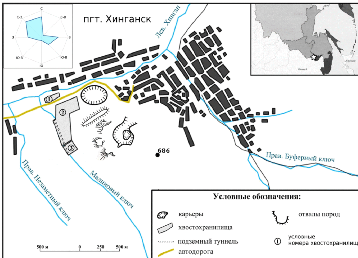
Рис. 1. Схема расположения техногенных образований Хинганского горно-обогатительного комбината

Отходы обогащения представляют собой тонко измельченные руды и вмещающие породы с размером фракций от песчаных до лессовидных и глинистых, в которых нами зафиксировано наличие соединений тяжелых металлов (ТМ), таких как Mn, Zn, Pb, Cu, As, Co, Ni в концентрациях выше кларковых, кроме кобальта и никеля. Обобщенный концентрационный ряд их представлен