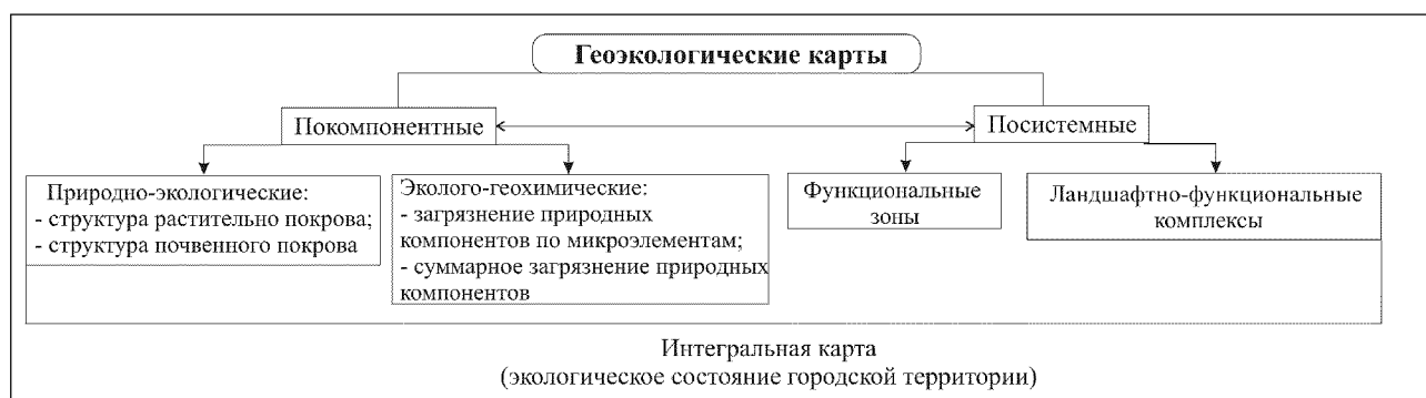
Рис. 2. Тематические составляющие интегральной карты, отражающей экологическое состояние городской среды

к которым относятся урбогеосистемы, прибегают к их содержательному расчленению. Здесь традиционно используется два основных пути их делимитации – покомпонентный и посистемный [1, 13].